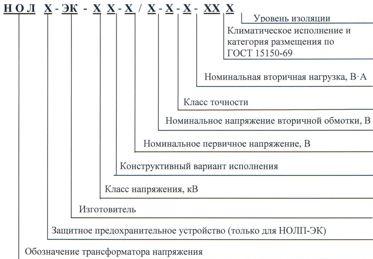
Рисунок 3 - Расшифровка условного обозначения трансформаторов напряжения